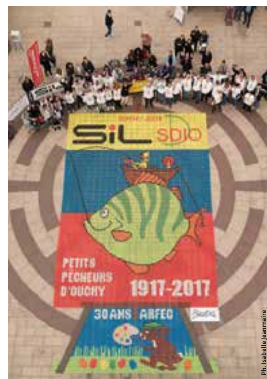
La mosaïque avec tous les bénévoles

Dimanche de Pâques, une petite pluie vient laver la mosaïque et rend les œufs encore plus beaux. Durant les deux nuits, un garde a surveillé la place, afin d'éviter que des fêtards s'amuse avec les œufs. Le garde est accompagné d'un chien, ce qui éloigne, au petit matin, les oiseaux qui voudraient bien profiter d'un festin protéiné. Ensuite tout