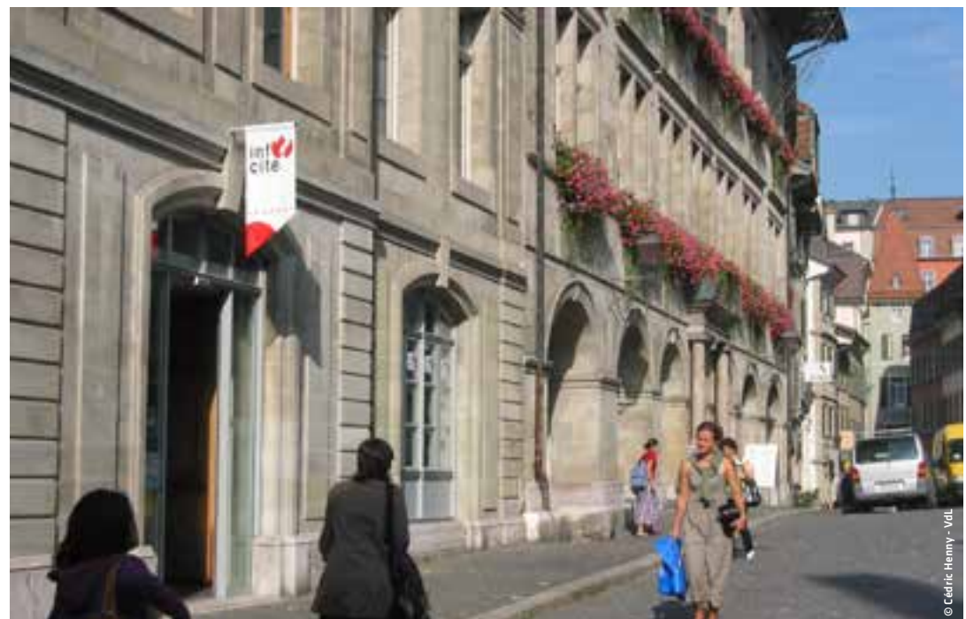
L'entrée d'info cité à la Palud.

Le bureau d'info cité est à disposition des habitants ou des visiteurs, huit heures par jour à la Place de la Palud 2. On y trouve toutes sortes d'informations sur la ville, et trois employés répondent aimablement aux demandes... même les plus imprévisibles.