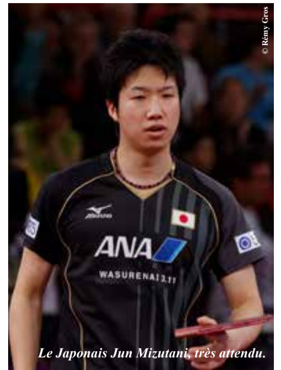
Le Japonais Jun Mizutani, très attendu.

Adulte 20.- AVS, AI, Etudiants 10.- / Enfant 5.-. Tarif pour les deux jours : Adulte 30.- AVS, AI, Etudiants 15.- / Enfant 10.-. Gratuit vendredi soir. Prélocation www.sttopen.ch .