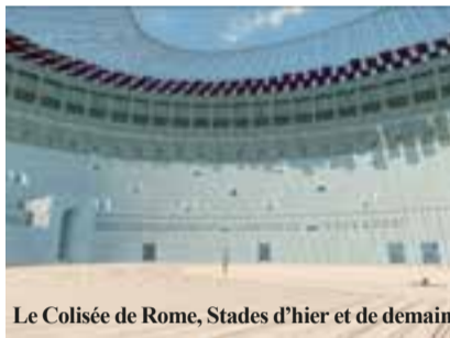
Le Colisée de Rome, Stades d'hier et de demain