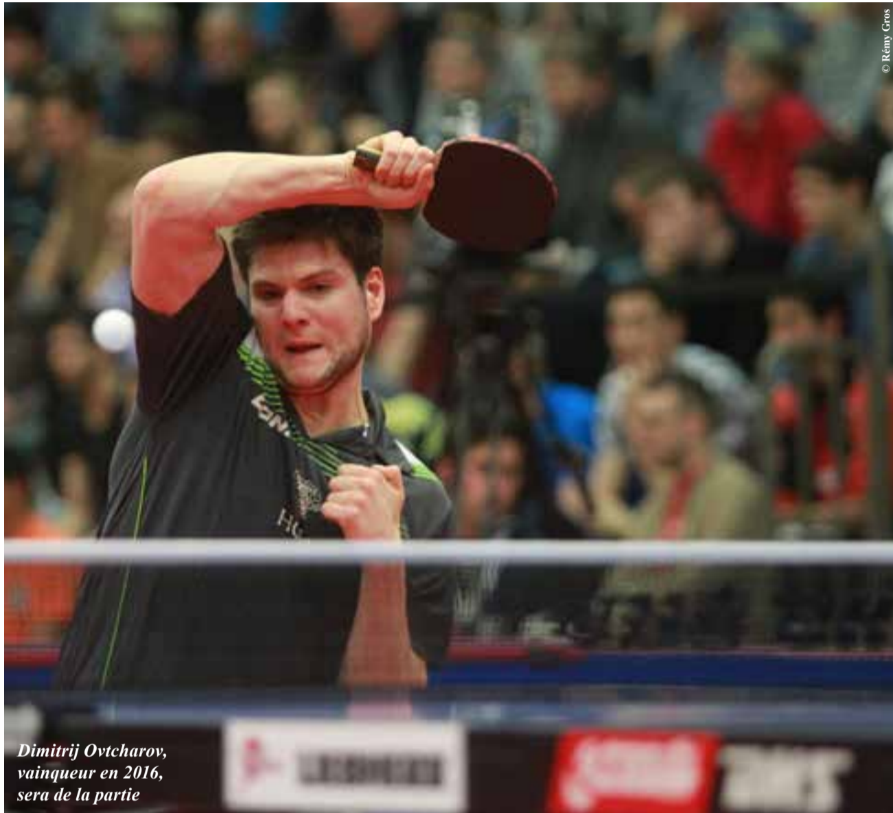
Dimitrij Ovtcharov, vainqueur en 2016, sera de la partie