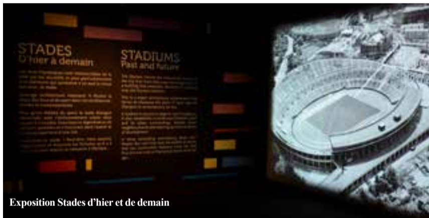
Exposition Stades d'hier et de demain