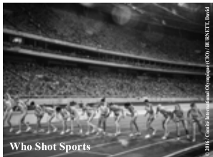
Who Shot Sports