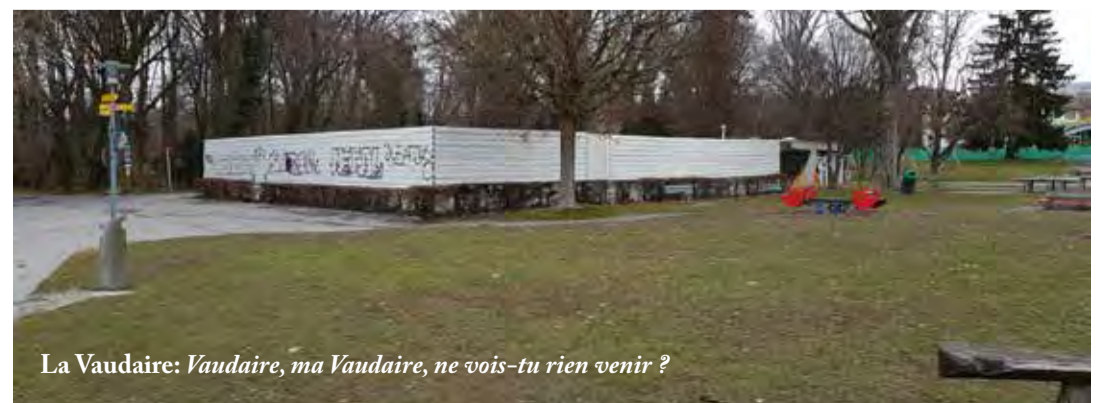
La Vaudaire: Vaudaire, ma Vaudaire, ne vois-tu rien venir ?