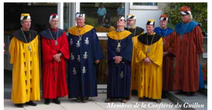
Membres de la Confrérie du Guillon

Dès lors le travail commence : projet, budget, information, financement, recherche de fonds, promotion sont les étapes indispensables impliquant tant le Conseil que le Syndic lui-même dont dépend notre vénérable vigne.