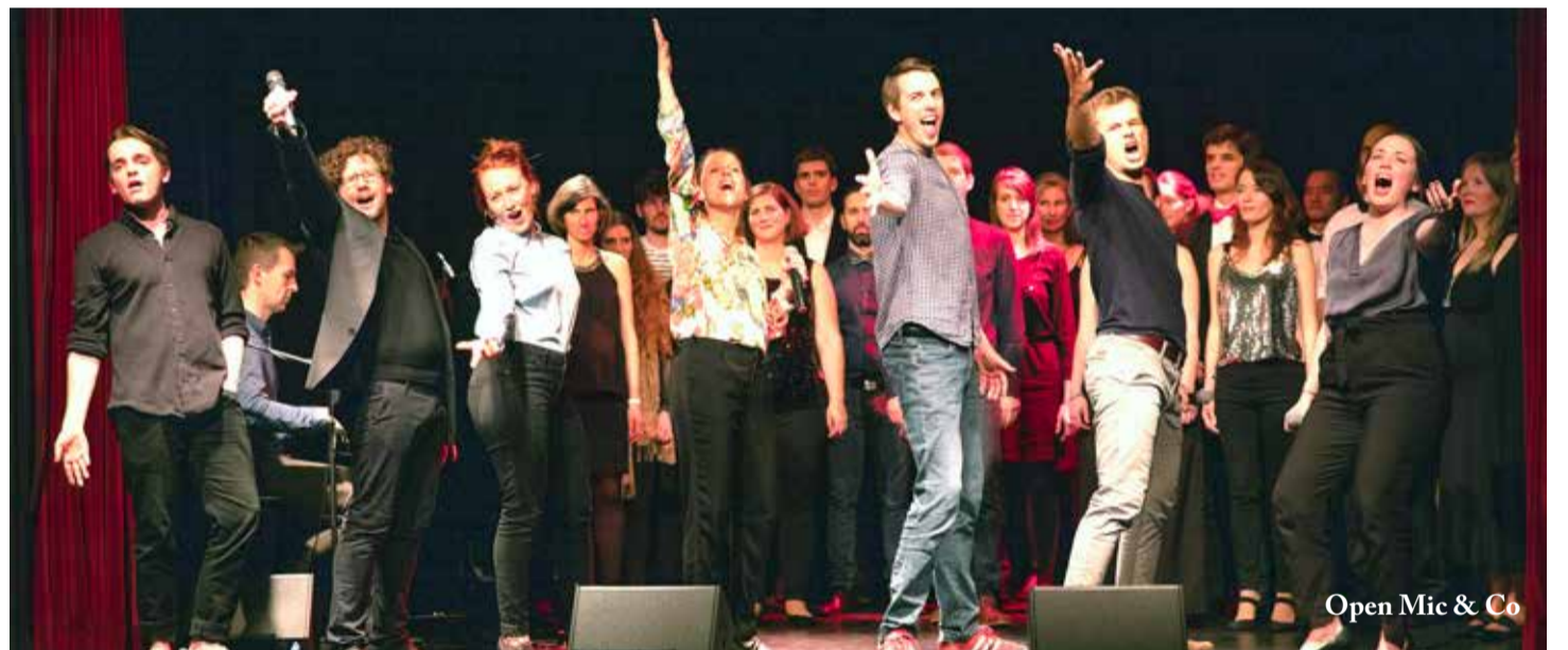
Open Mic & Co

Depuis tout petit, Robert aurait voulu être variétologue. Ou variéticien. Ou variéteur. Bref, un spécialiste en chansons de variété. Parce qu'il y a une chanson pour tout, pour tous. Parce que la variété, c'est le passé, le présent... OK, peut-être pas l'avenir. Parce que, comme ce spectacle, sans y toucher, l'air de rien, la variété raconte nos vies. Depuis tout petit, Robert n'a pas de père. Il l'a bien vécu. Cela le