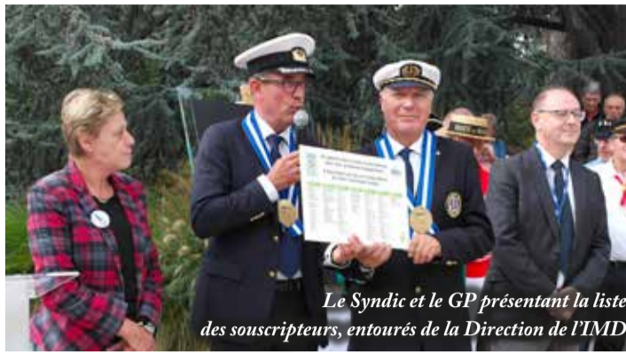
Le Syndic et le GP présentant la liste des souscripteurs, entourés de la Direction de l'IMD

Et quand je dis endosser, ce n'est que le prénom de ce qui fut un long chemin étayé de multiples activités et de manifestations dont il fut l'instigateur, le penseur, le réalisateur, le promoteur et, souvent, le vainqueur... une période très riche en événements qu'il réalise à la lumière de sa syndication, à peine ombragée par les grands patrons qui sont passés dans son sillage. Parmi les nombreux projets, il en est un qui est à l'origine de celui qui trouve sa continuité aujourd'hui : la vigne. L'idée de cette vigne oscherine lui est venue «en refaisant le monde autour de la table Une» du