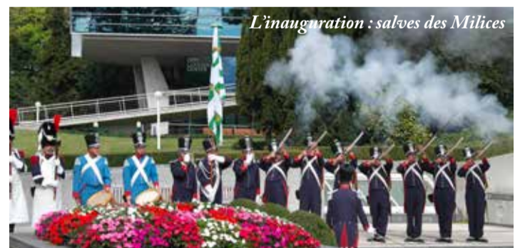
L'inauguration : salves des Milices

Malgré les perspectives générales prometteuses d'une belle année viticole 2019 du vignoble vaudois, la Commune libre et indépendante d'Ouchy n'avait pas cette année de quoi fêter la traditionnelle vendange de sa vigne. Le mercredi 25 septembre on remplaça donc la vendange par l'inauguration de la nouvelle vigne, l'occasion de réunir et de remercier tous les généreux souscripteurs de ces deux cent cinquante nouveaux ceps fraîchement plantés par nos Maîtres vignolants. Tous nos souscripteurs ou presque étaient de la fête, qui débuta par un cortège au départ du cabanon des Pirates pour se rendre dans les jardins de l'IMD. Dans un élan de sympathie et d'amitié, étaient réunis sur le parvis de l'IMD des délégations des Milices vaudoises, des Confréries des Vignerons, de la Perche, du Guillon. Rappelant la récente Fête des Vignerons veveysanne, étaient présents un groupe des Cent Suisses, les tâche-