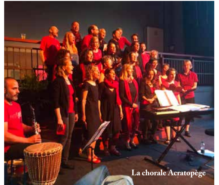
La chorale Acratopège

Ad Opéra et la Maison de Quartier présentent Une Demoiselle en Loterie , de Jacques Offenbach dans le cadre de son bicentenaire. Il s'agit d'une opérette pour trois chanteurs et sept musiciens. Réser-