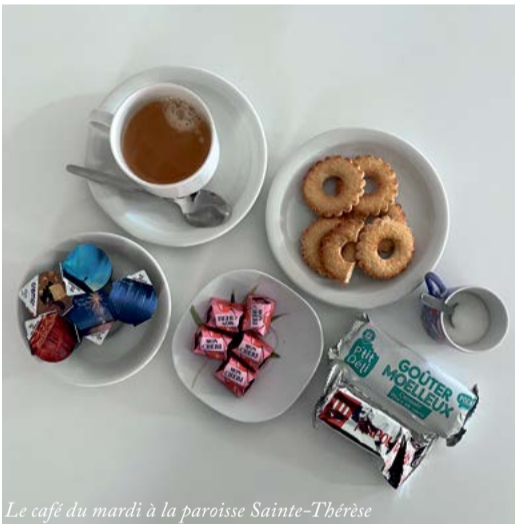
Le café du mardi à la paroisse Sainte-Thérèse