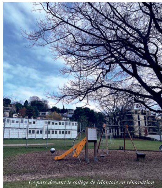
Le parc devant le collège de Montoie en rénovation

Pour échapper au shopping déprimant, à des clients de plus en plus esquinés socialement ou carrément en proie à des monstres psychiques, il faut traverser la ligne de démarcation pauvres/riches, c'est-à-dire rejoindre l'avenue de Cour après Figuiers. Vous me direz, marcher c'est bon pour la santé. Envoyez donc vos gosses y faire les courses (23,1% ont moins de 19 ans), les personnes âgées (2,8% ont 80 ans et plus) n'ont qu'à se débrouiller avec leurs déambulateurs. Ce que j'aperçois quotidiennement me fend le cœur : combien de personnes du 3 e âge, seules, tirant difficilement leur chariot à commissions, des packs de bière, remontant la rue avec un cornet plastique pour le repas du jour payé par l'AVS, devant s'arrêter tous les dix pas pour reprendre leur souffle. Dans l'indifférence générale. Les corps sont pressés et les esprits absorbés par des écrans de téléphone. J'ai proposé mon aide : on m'a répondu non. L'arthrose a sa fierté.