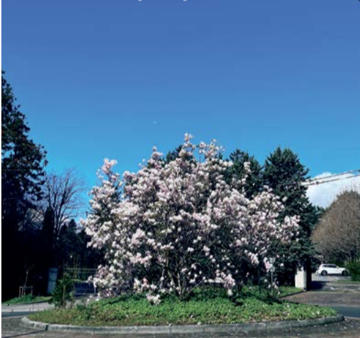
L'entrée du cimetière au printemps

D'abord le lieu. Ce moribond se situe entre l'avenue de Montelly (au nord), le terminus du bus 6 « Maladière » (au sud), l'entrée de la Vallée de la Jeunesse (à l'ouest) et le début de l'avenue du Mont-d'Or (à l'est). Sur les plans de la ville de Lausanne, il est cadastré « sous-secteur 401 » dans le « quartier No 4 » (Montoie/Bourdonnette), la ville de Lausanne en comptant 18. Un no man's land, traversé de haut en bas par l'avenue éponyme, avec une limitation de vitesse à 30 km/h jour et nuit, mais rarement respectée en dépit des dos d'ânes, rétrécissements de chaussée et autres agents de police, qui se planquent à mi-route sous un saule pleureur pour flasher un maximum de chauffards avec leur « pistolet radar » portatif. Oui, notre petit quartier en pente se traverse à toute berzingue, direction l'autoroute, puisque de toutes façons il n'y a aucune raison de freiner pour s'y arrêter. Pas de kebab, pas de pizzeria, pas de boulangerie, pas d'épicerie, pas de kiosque à journaux et à bonbons, pas de buvette, pas de food truck (ces camionnettes de restauration sur le pouce). Une zone dortoir, une zone tampon entre deux quartiers en expansion, Vidy et Malley.