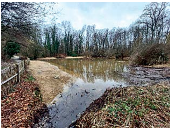
A l'issue des travaux