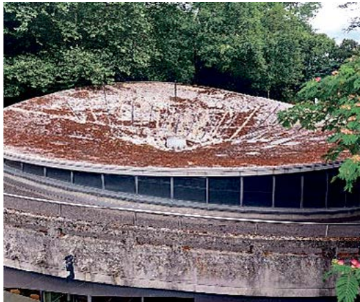
Le cadran subissant les affres de la nature

Une annonce parue dans la Feuille des avis officiels du 19 août nous apprend plusieurs mesures: suppression de seize places de parc et/ou «parcage contre paiement, avec ou sans macaron» dans plusieurs rues lausannoises dont en ce qui concerne la SDSO: Cour, Figuiers et Montelly. Eu égard au fait que la FAO n'apporte aucun éclairage précis, nous avons cherché à en savoir plus dès la parution de l'annonce mais en vain, malgré plusieurs rappels à l'Office compétent de la signalisation auquel nous avons été renvoyés. Il ne reste plus qu'à espérer que notre secteur ne soit pas encore plus touché.