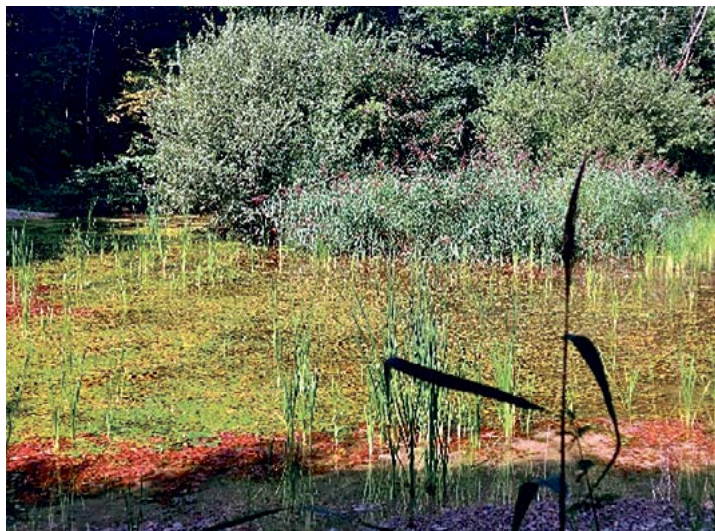
Etat actuel qui vaut le détour