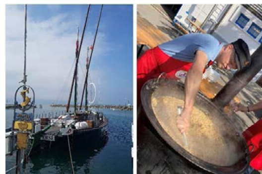
Désarmement d'automne, suivi du Risotto

Après une saison que l'on peut d'ores et déjà qualifier de réussie, la Vaudoise sera à nouveau mise au repos pour l'hiver le samedi 11 octobre, coïncidant avec le Risotto d'automne proposé, dès 11 heures, par la Nana et les cambusiers de la Confrérie.