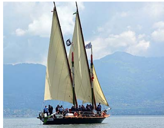
Sortie des présidents

Mercredi 10 septembre, à 17 heures aura eu lieu la traditionnelle navigation de la Vaudoise avec à son bord les présidents des sociétés oscherines. Elle sera suivie de la non moins traditionnelle séance permettant des échanges d'expériences, agrémentés d'une toujours savoureuse raclette concoctée par les cambusiers de la Confrérie des Pirates d'Ouchy.