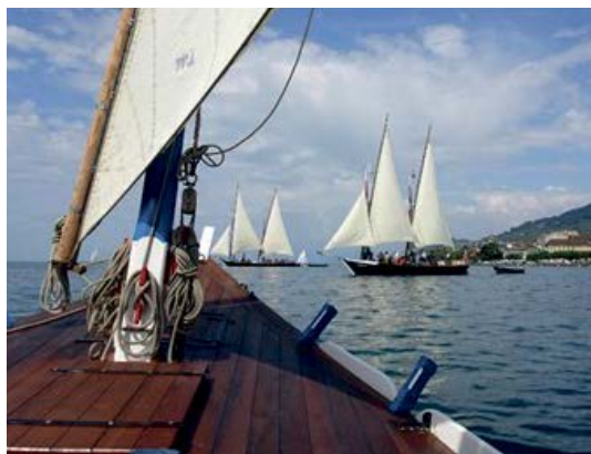
Distribution du Trophée au large